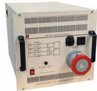
75A三相インピーダンスネットワーク