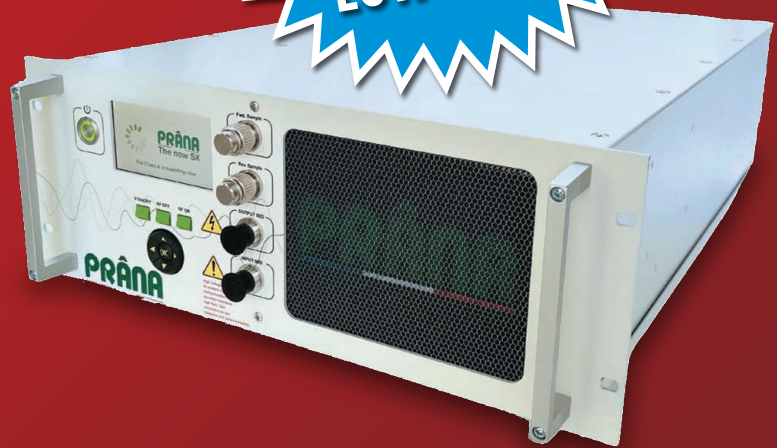
SX250 Typical Output